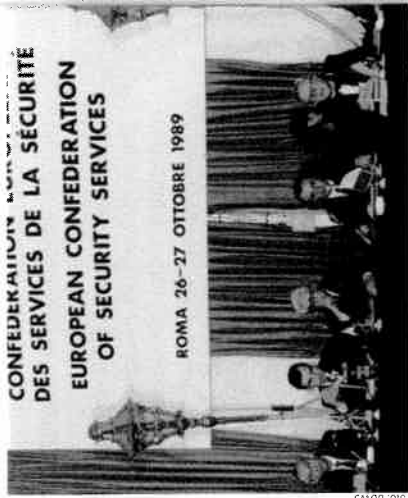
Die Gründungsveranstaltung der Co-ESS im Jahr 1989.

Der Dachverband europäischer Sicherheitsdienstleister, die Confederation of European Security Ser-